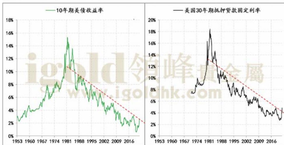
10年美债收益率与30年按揭贷款利率走势

(注：交易数据仅作为交易密集度的一个反映，不作为真实交易数据解读，数据来源网络相关统计。)